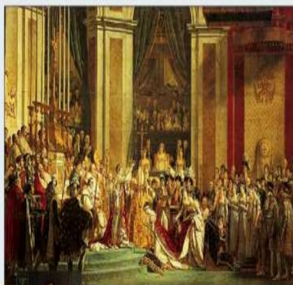
Napoléon couronné empereur